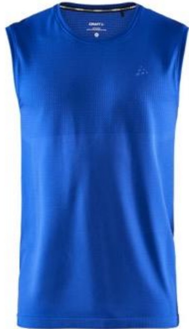
Fuseknit Light RN SL M 1908842-360000