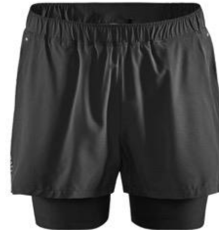
ADV Essence 2-in-1 Stretch Shorts M 1908764-999000