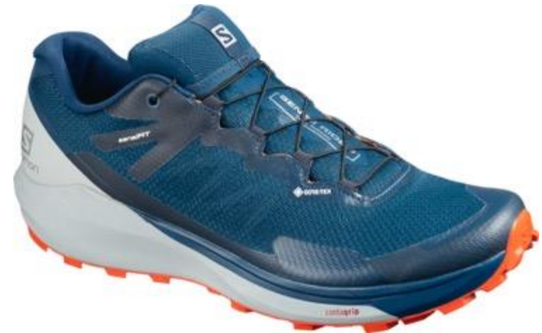
SENSE RIDE 3 GTX INVIS. FIT L40975200 On-Trail