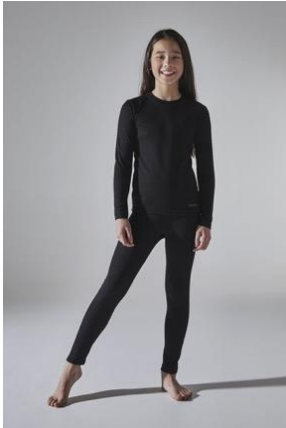
CORE Warm Baselayer Set Jr 1909712-999000