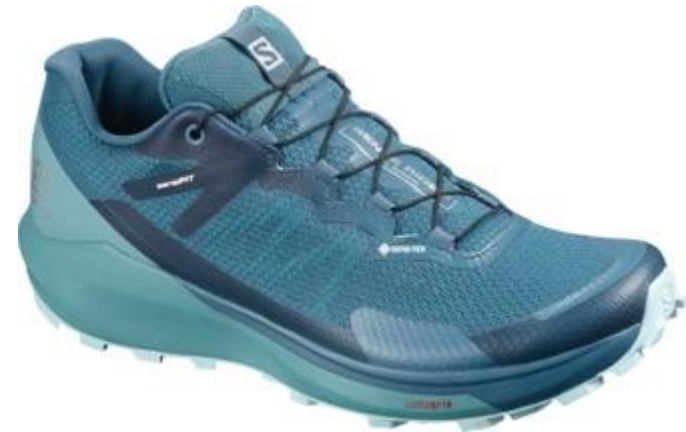
SENSE RIDE 3 GTX INVIS. FIT W L40975000 On-Trail