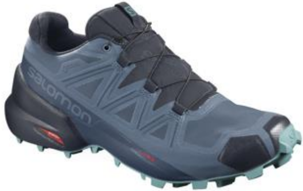
SPEEDCROSS 5 GTX W L41117500 Off-Trail