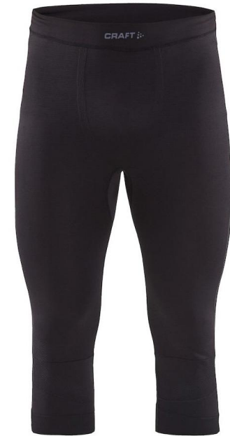
Active Intensity Knickers M 1907935-999995