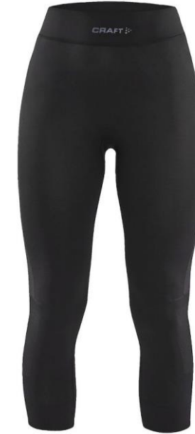
Active Intensity Knickers W 1907939-999995