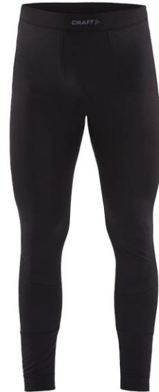
Active Intensity Pants M 1907936-999995