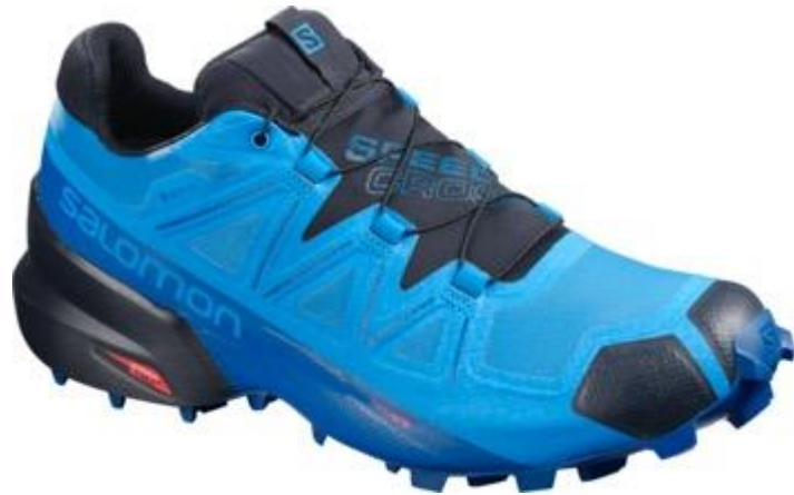
SPEEDCROSS 5 GTX L40957100 Off-Trail