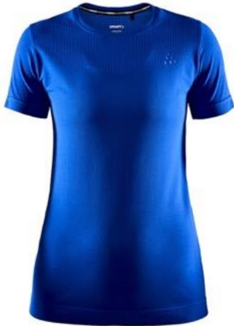
Fuseknit Light RN SS W 1908846-360000