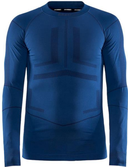
Active Intensity CN LS M 1907933-349396