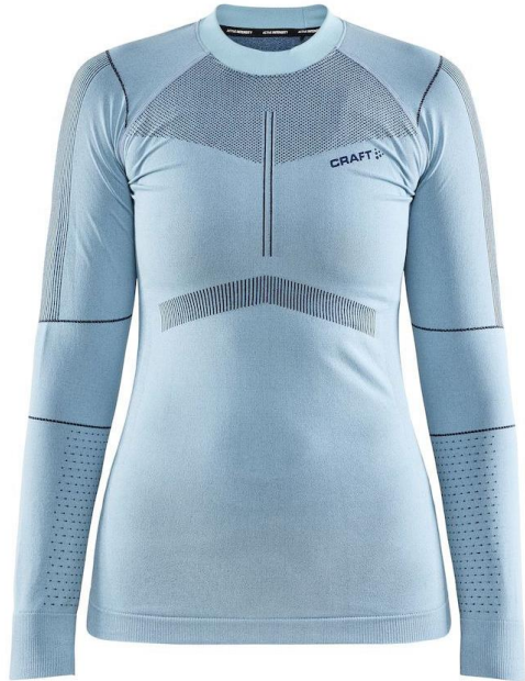
Active Intensity CN LS W 1907937-319349