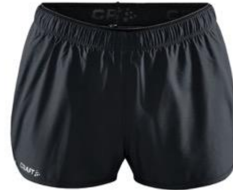
ADV Essence 2" Stretch Shorts W 1908781-999000