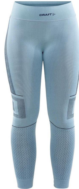
Active Intensity Pants W 1907940-319349