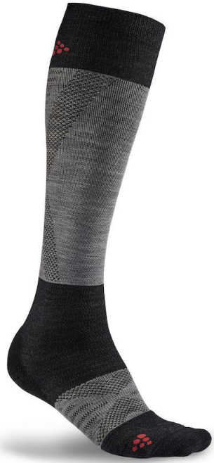
Alpine Warm Socks 1907897-950975