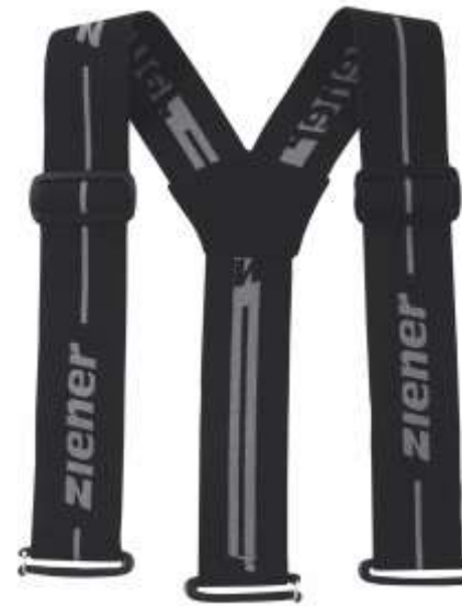
Braces Teamwear Gr.S/M/L