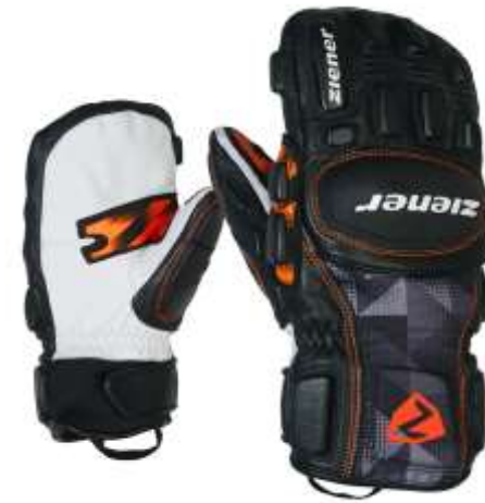
Lexom PR Mitten Junior (Gr.3,0 -7,5) (Aller 4-15 Jahre)