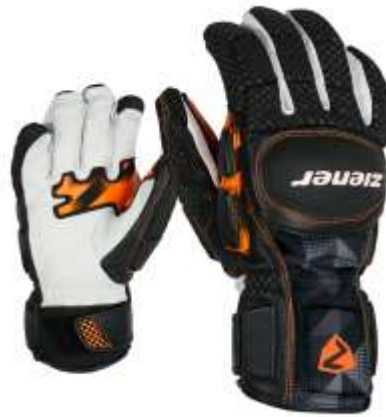
Gatos PR (Finger) (Größen 6,5 -11,0)