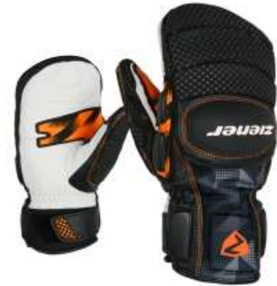
Gatoro PR Mitten (Fäustling)