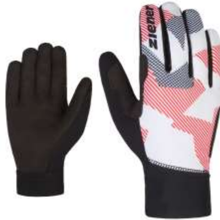
Gr. 5,0 – 11,0