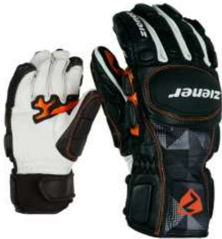
Lexo PR Junior (Gr.3,0 -7,5) (Alter 4-15 Jahre)