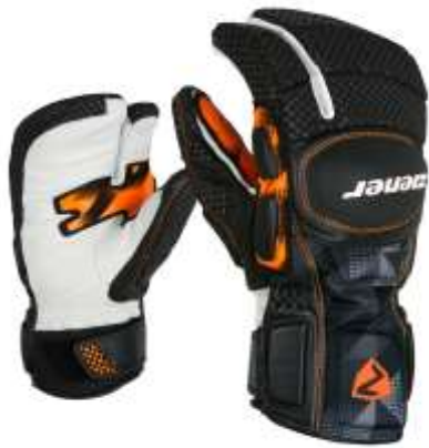
Gator PR (Lobster)