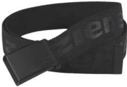
Jerke Belt Unisex alternativ blau od. orange