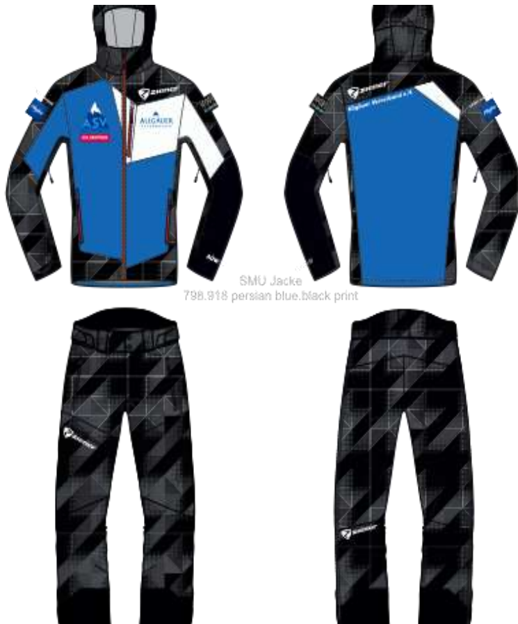
SMU Jacke 798.918 persian blue.black print