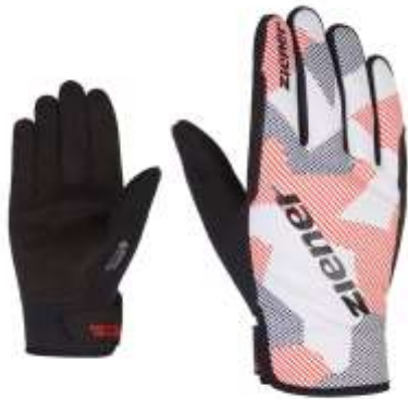
URSO GTX INF Gr. 5,0 – 11,0